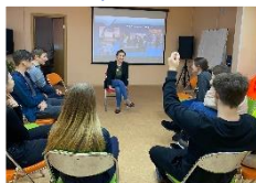
Центр современных технологий и профориентации