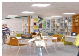
Информационно- библиотечный центр