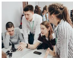
Центр Российского движения детей и молодежи