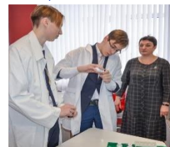
Центры естественных наук